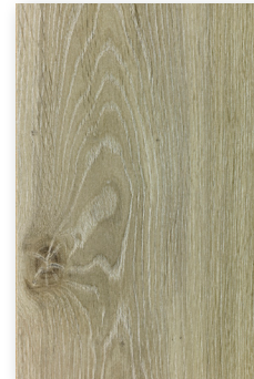
449 ROBLE NEVADA *