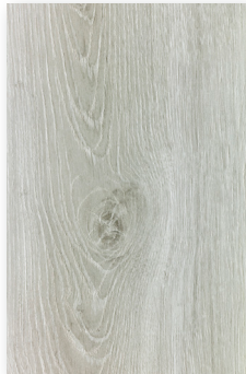
448 ROBLE GRIS *