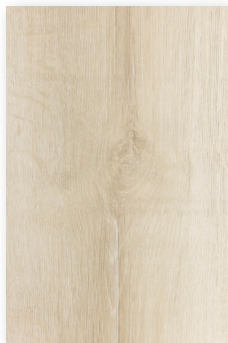
502 BLANCO ALGODÓN **