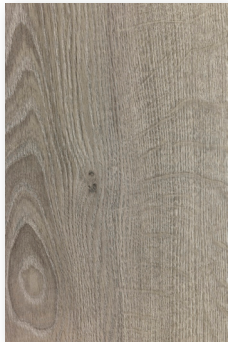
437 GRIS BUILDING *