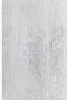
183 EVEREST **