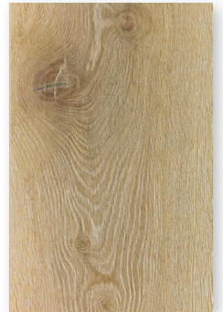
450 ROBLE NATURALEZA *