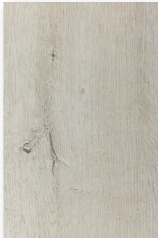
409 CASANDRA **