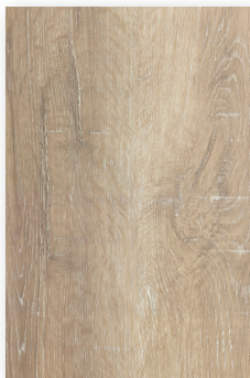
456 ROBLE PROVENZA **