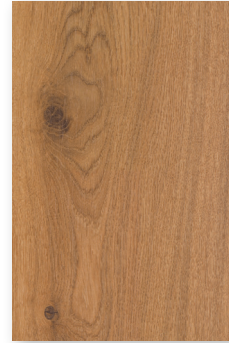
224 ONTARIO **