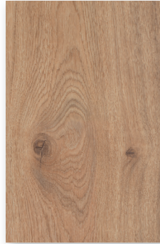
223 JASPER **