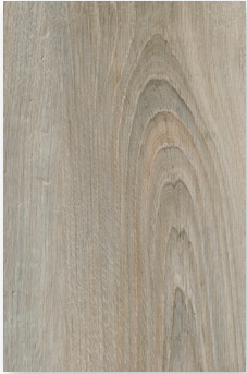
153 ROBLE CÉLTICO **