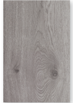
226 BAFFIN **