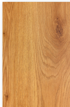
543 ROBLE MIEL **