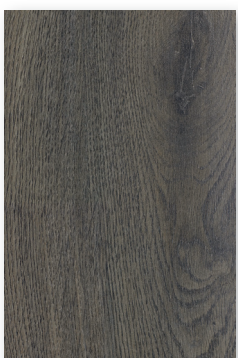
542 ROBLE ARONIA *