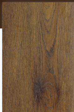
528 ROBLE AVELLANA *