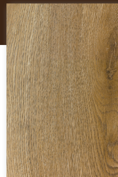
535 ROBLE TURRÓN *