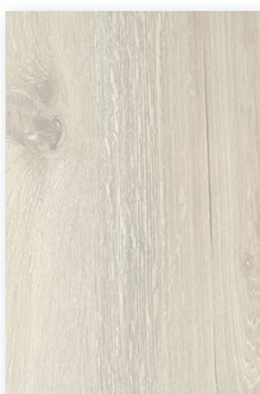
701 PLATÓN *