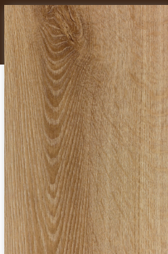
436 ROBLE ALPACA *