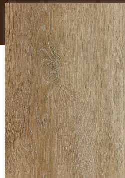
529 ROBLE ALMENDRA *