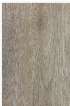
536 ROBLE LINO *