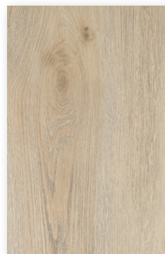
702 ARISTÓTELES *