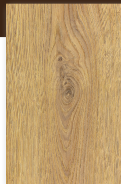
514 NAMUR *