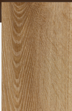
436 ROBLE ALPACA *