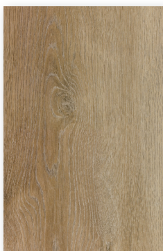
529 ROBLE ALMENDRA *