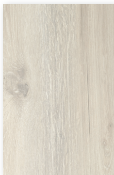
701 PLATÓN *