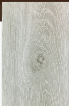
448 ROBLE GRIS *