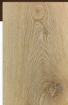
450 ROBLE NATURALEZA *