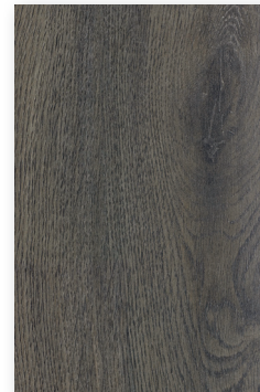
542 ROBLE ARONIA *