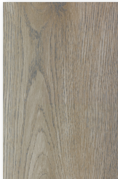
536 ROBLE LINO *