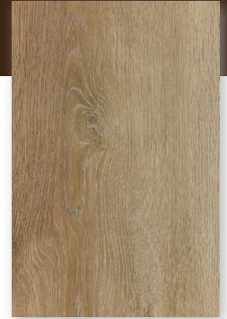
529 ROBLE ALMENDRA *