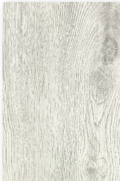
541 ROBLE COCO *