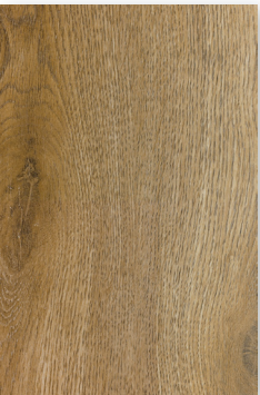
535 ROBLE TURRÓN *