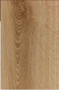
436 ROBLE ALPACA *