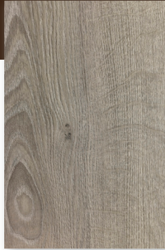
437 GRIS BUILDING *