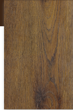
528 ROBLE AVELLANA *